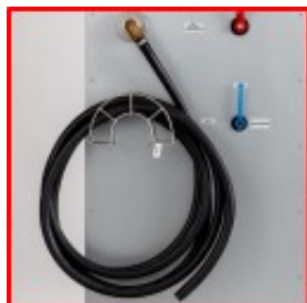
Hurtig udvendig påfyldning af diverse tanke, vandingsvogne eller fejesugemaskiner hurtigt, sikkert og uden vandspild.